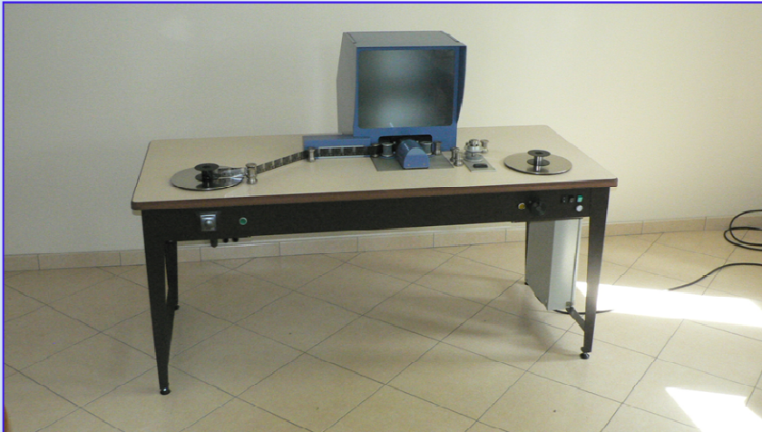
Photo: Table installée aux Archives Départementales des Landes (40) France

NOTRE QUALITÉ À VOTRE SERVICE DEPUIS 30 ANS