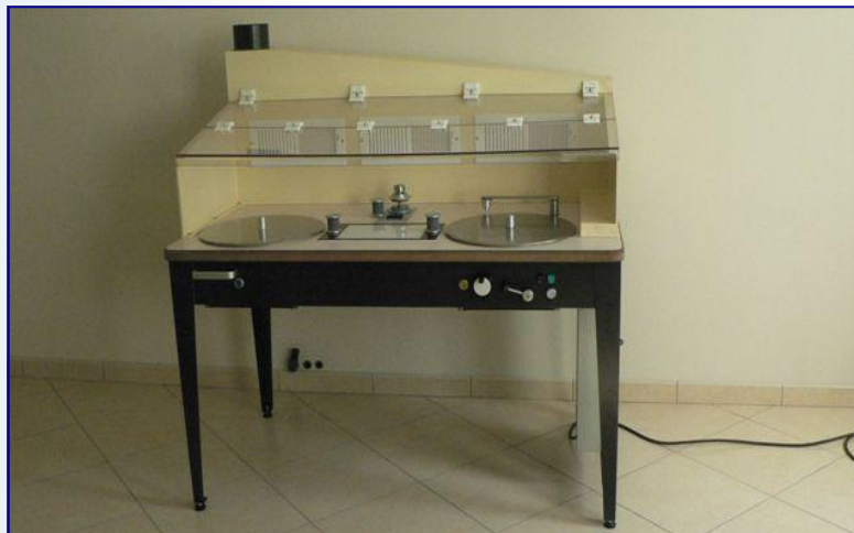
Photo : équipement installé à la Cinémathèque Française