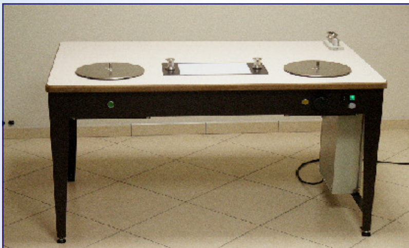
PHOTO : table installée à la Bibliothèque nationale de France (Centre technique de Bussy St Georges)

NOTRE QUALITÉ À VOTRE SERVICE DEPUIS 30 ANS