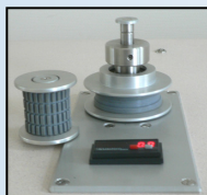
Galet, frette silicone Compteur